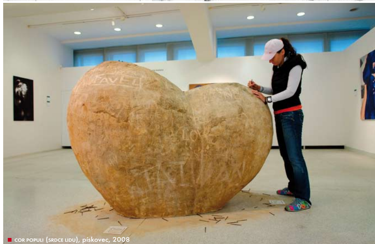
■ COR POPULI (SRDCE LIDU), pískovec, 2008

potká, se odrazí na oční duhovce, tím se zabývá i diagnostická metoda iridoskopie. Všechno, co mi osud hodí pod nohy, mám v úmyslu postupně přetransformovat do hudby. U HUDBY Z POHYBU SLUNCE vycházím z toho, že Slunce má obrovskou energii, ovlivňuje náš život, který však člověk bohužel svými výzkumy a zdokonalováním světa ničí. Chtěla jsem